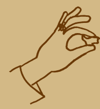
つみき Building block